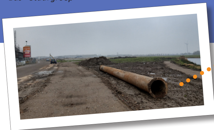
Ons toekomstig terrein omsloten met het fietspad (links) en het voetpad (rechts)